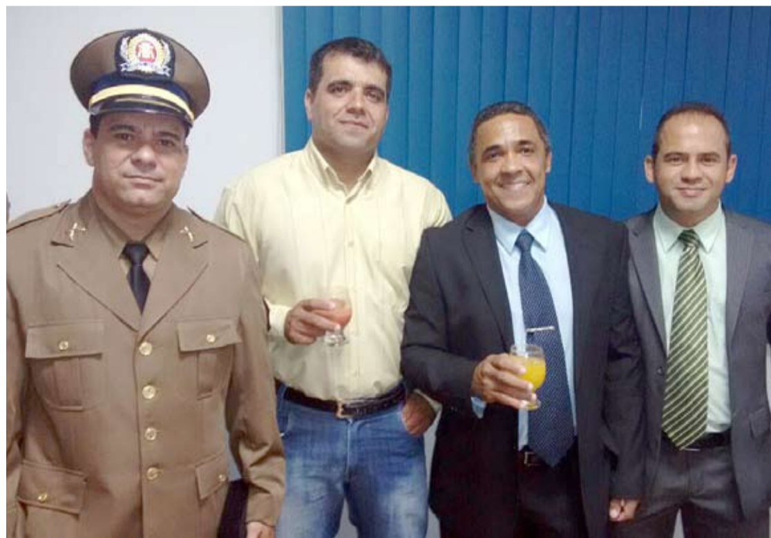
A equipe da APNM compareceu ao evento para hipotecar o seu apoio e solidariedade aos companheiros que estavam sendo homenageados