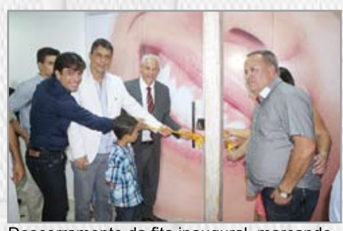
Descerramento da fita inaugural, marcando solenemente a inauguração do complexo