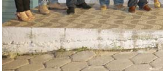
Inauguração da unidade regional do Bairro São Jacinto