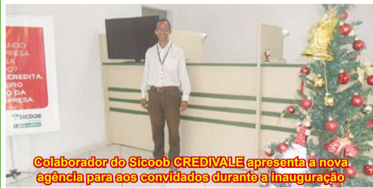
Colaborador do Sicoob CREDIVALE apresenta a nova agência para aos convidados durante a inauguração