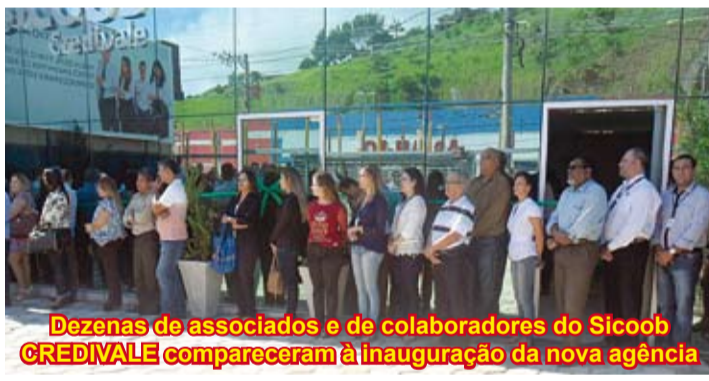
Dezenas de associados e de colaboradores do Sicoob CREDIVALE compareceram à inauguração da nova agência